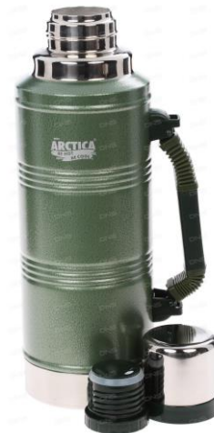
Термос Арктика 106- 2200P зеленый