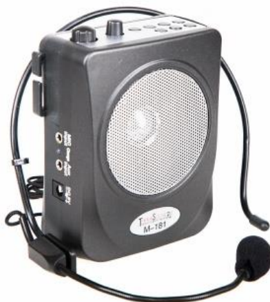
М-181 Усилитель голоса мегафон поясной 15Вт с mp3 плеером