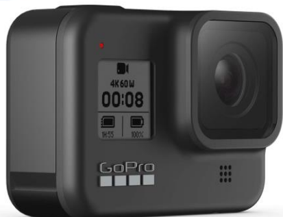
Камера GoPro HERO8 Black

Использование новейшего оборудования, позволяющего подготовить специалистов с актуальными знаниями по использованию новейших технологий в индустрии гостеприимства в полевых условиях