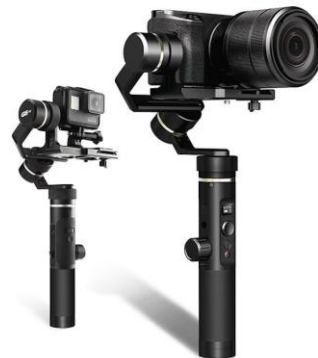
Стедикам универсальный Feiyu Tech G6 plus