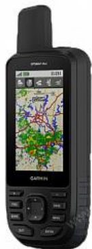
Туристический навигатор Garmin GPSMAP 66ST

Использование новейшего оборудования, позволяющего подготовить специалистов с актуальными знаниями по использованию новейших технологий в индустрии гостеприимства в полевых условиях