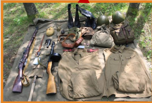
Материально-техническая база проекта