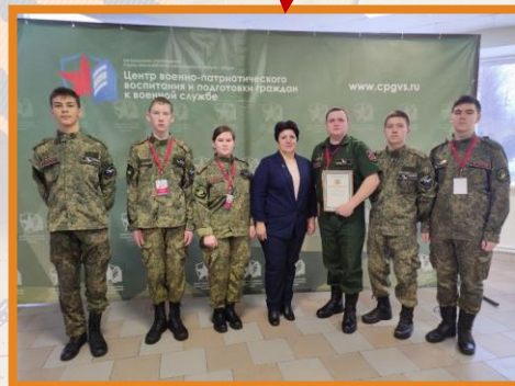
Поддержка от спонсоров и партнеров