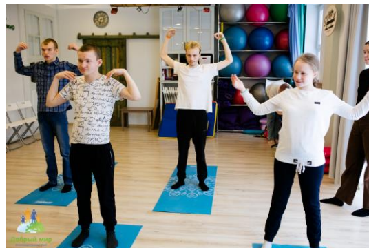
Адаптивная физическая культура