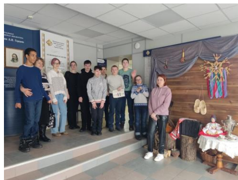
Группа по освоению социально-бытовых навыков