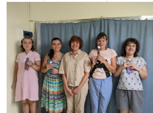
Группа по созданию народной текстильной куклы