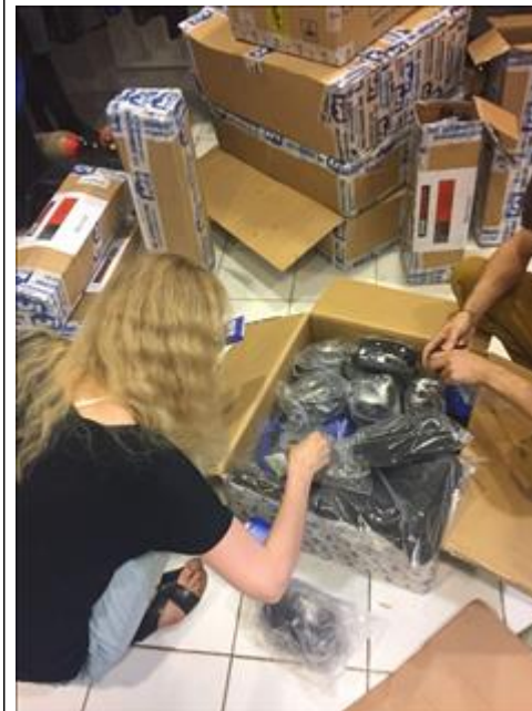
Приобретенное оборудование для дайвинга Распаковывание доставленного оборудования в СКК "Галактика" от фирм "Тетис" и "Дайвиндустрия"