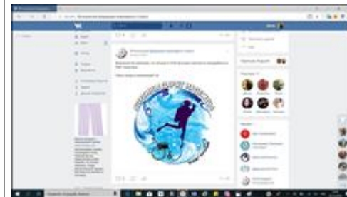
Информация в соцсети ВКонтакте. Информация в официальной группе ВКонтакте.