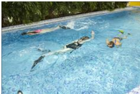
Тренировка по парадайвингу в воде Тренировка в бассейне аквапарка с комплектом № 1 для дайвинга (трубка, маска, ласты)