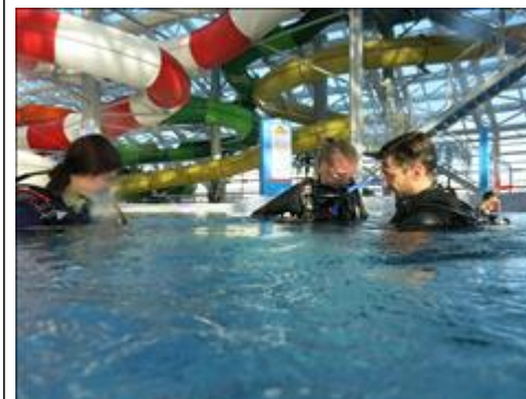
Занятие с инструктором по дайвингу из г. Когалыма Инструктор проверяет надежность фиксации снаряжения у занимающегося