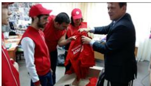
Приобретенная экипировка для волонтеров Примерка экипировки