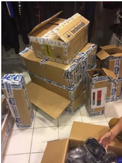
Приобретенное оборудование для дайвинга Распаковывание доставленного оборудования в СКК "Галактика" от фирм "Тетис" и "Дайвиндустрия"