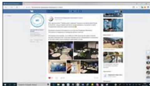
Информация в соцсети ВКонтакте Информация в официальной группе ВКонтакте.