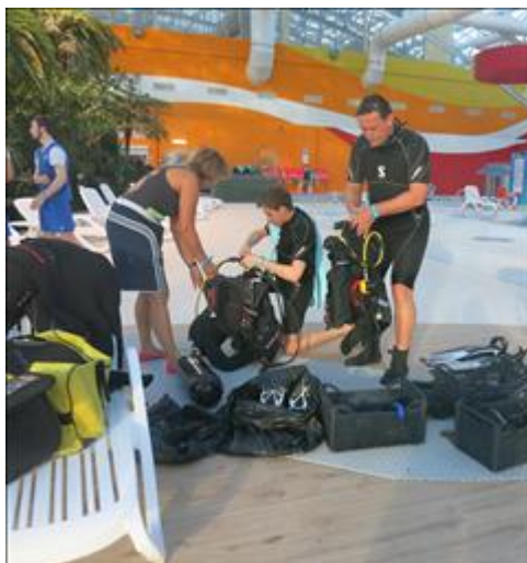
Тренировка по парадайвингу в бассейне аквапарка Подготовка оборудования для работы под водой.