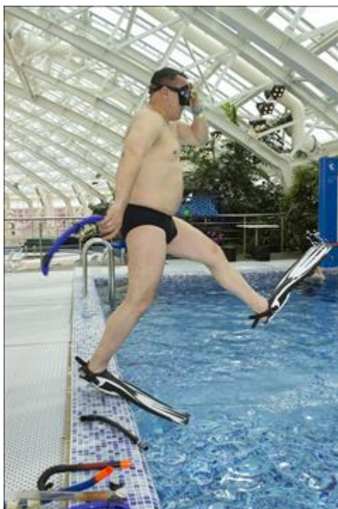
Тренировка по парадайвингу в бассейне аквапарка Тренировка в бассейне аквапарка с комплектом № 1 для дайвинга (трубка, маска, ласты): отработка входа в воду с низкого борта лицом к воде.