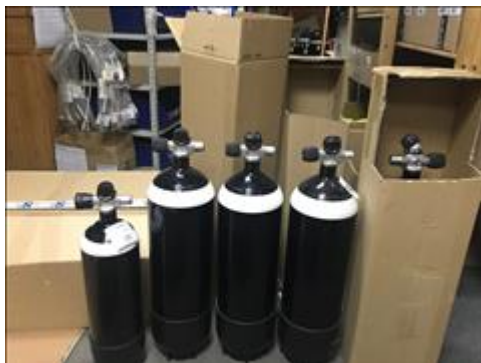
Приобретенное оборудование для дайвинга Баллоны для дайвинга