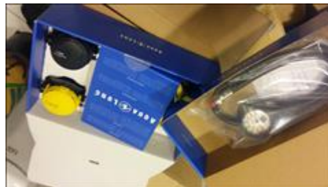
Приобретенное оборудование для дайвинга Регуляторы - 1 и 2 ступень для выравнивания давления воздуха в баллоне до давления окружающей среды.