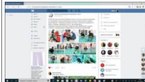
Информация в соцсети ВКонтакте Информация в официальной группе ВКонтакте.