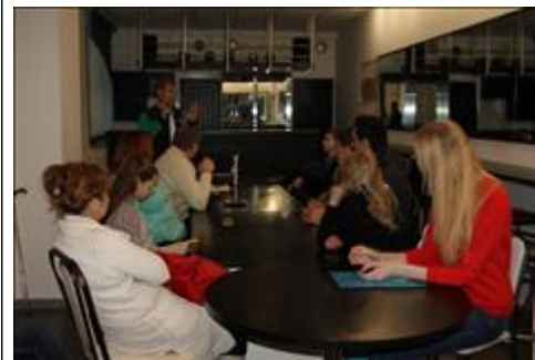
Беседа инструктора по парадайвингу с инвалидами. Психологическая подготовка к тренировочному процессу.