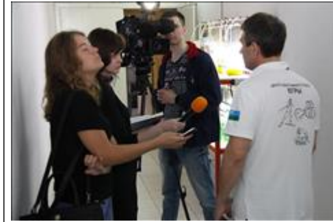
Работа местной телекомпании Инфосервис Журналист берёт интервью у инструктора по парадайвингу из г. Ханты-Мансийска.