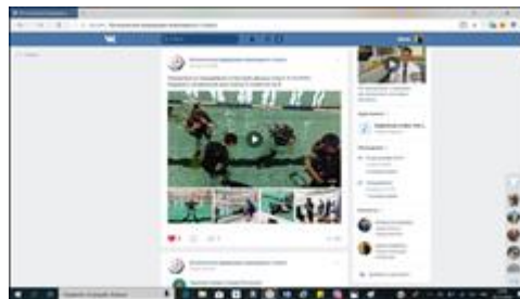
Информация в соцсети ВКонтакте. Информация в официальной группе ВКонтакте.