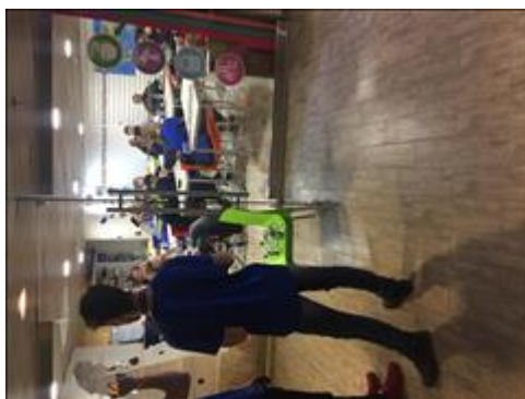
Беседа с потенциальными участниками групп по парадайвингу Беседа инструктора по дайвингу с инвалидами, определение графика.