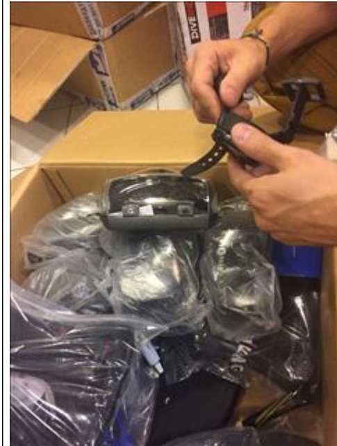
Приобретенное оборудование для дайвинга Маски для подводного плавания