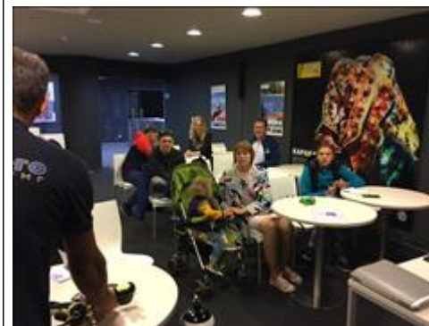
Теоретическое занятие по парадайвингу Инструктор описывает снаряжение, рассказывает для чего оно необходимо, объясняет технику безопасности и как правильно с ним работать на суше и под водой.