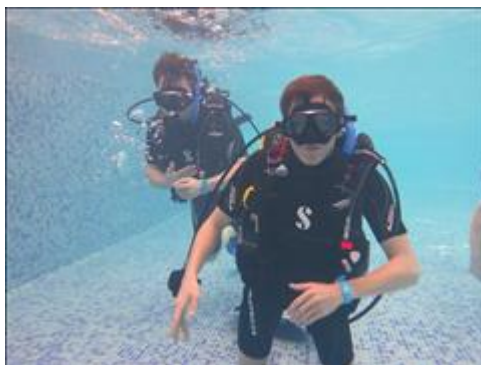
Тренировка по парадайвингу в бассейне аквапарка Отработка упражнения по поиску регулятора для дыхания, в случае необходимости.