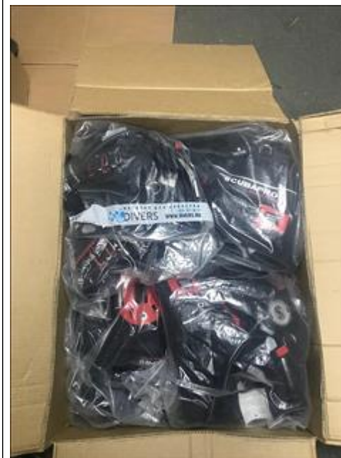
Приобретенное оборудование для дайвинга Жилеты компенсаторы