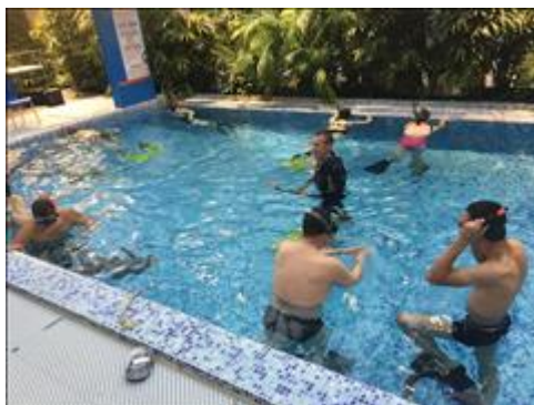
Тренировка по парадайвингу в бассейне аквапарка Инструктор показывает группе и контролирует процесс правильной работы в воде с комплектом для дайвинга № 1 (маска, ласты, трубка).

https://yadi.sk/i/fVFWpl2dhYr4Rg https://yadi.sk/i/YL3UlvND6GmVDA https://yadi.sk/i/377ah7GrJvF3ww https://yadi.sk/i/mv2xEUf3NyJC1g https://yadi.sk/i/Foxpcb2h6QH2aw https://yadi.sk/i/Q4rJtSxSC-OJNQ https://yadi.sk/i/yWI3YysnT1thKw