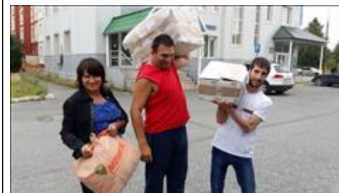
Приобретенная экипировка волонтерам Волонтеры с руководителем клуба "ДОБРОволец" переносят экипировку в здание.