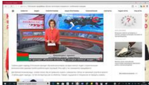
Видеосюжет выпуска новостей телеканала «Югра» Сюжет о реализации проекта в выпуске новостей окружной телерадиокомпании «Югра»