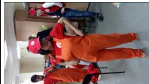
Приобретенная экипировка для волонтеров Примерка экипировки