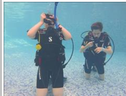
Тренировка по парадайвингу в бассейне Тренировка в бассейне аквапарка с с оборудованием в полной экипировки. Отработка упражнения по снятию и надеванию маски под водой.