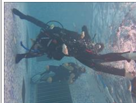
Занятие с инструктором по дайвингу из г. Когалыма Инструктор контролирует процесс выполнения упражнения.