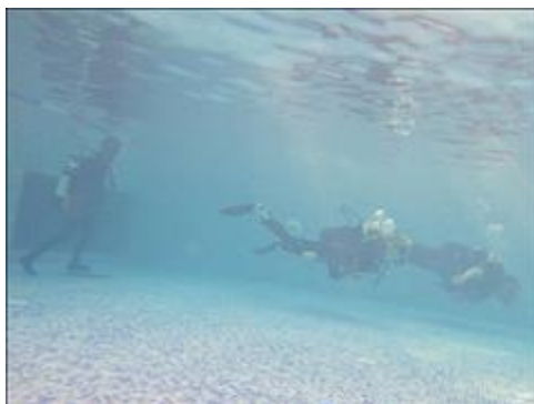
Занятие с инструктором по дайвингу из г. Когалыма Инструктор контролирует способность держать нейтральную плавучесть во время движения в воде.