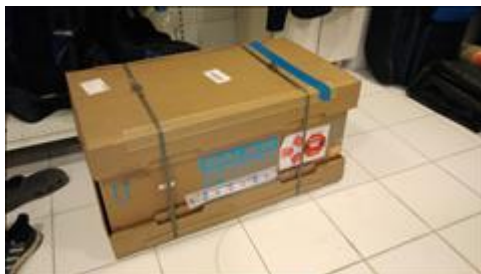
Приобретенное оборудование для дайвинга Распаковывание доставленного в СКК "Галактика" электрического компрессора от фирмы "Тетис" для забивки баллонов воздухом.