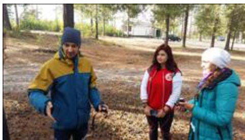
Занятие с инструктором по дайвингу из г. Когалыма Обучение групп работы с компасом