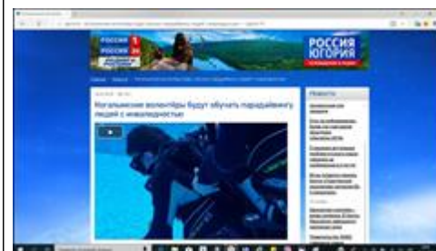
Видео сюжет ТРК Россия-Югория Сюжет о реализации проекта в выпуске новостей Филиал ВГТРК «Государственная телевизионная и радиовещательная компания «Югория»