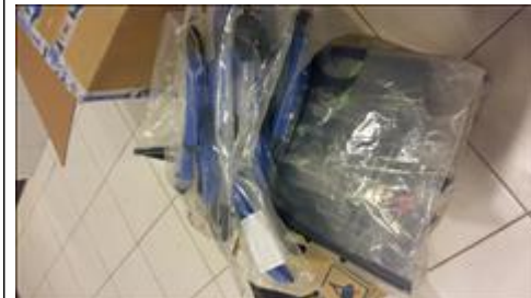
Приобретенное оборудование для дайвинга Трубки для плавания под водой