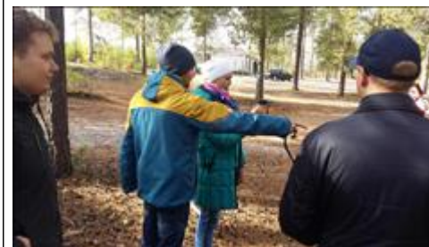
Занятие с инструктором по дайвингу из г. Когалыма Занятие с группой по работе с компасом