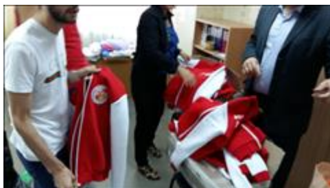
Приобретенная экипировка для волонтеров Вскрытие упаковок