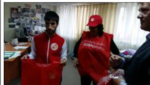
Приобретенная экипировка для волонтеров Примерка экипировки