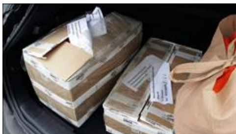
Приобретенная экипировка для волонтеров Доставленные комплекты экипировки