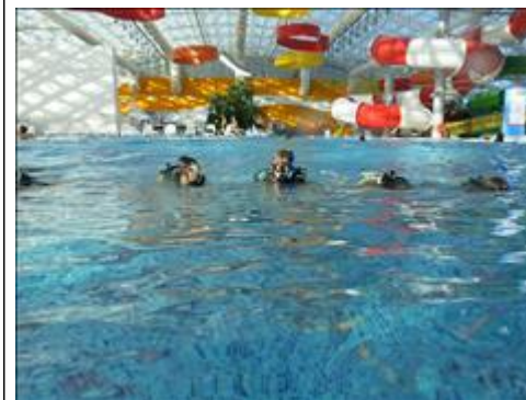
Тренировка по парадайвингу в бассейне аквапарка Отработка движений на поверхности воды в условиях волнения - отрабатывается в бассейне с искусственными волнами.