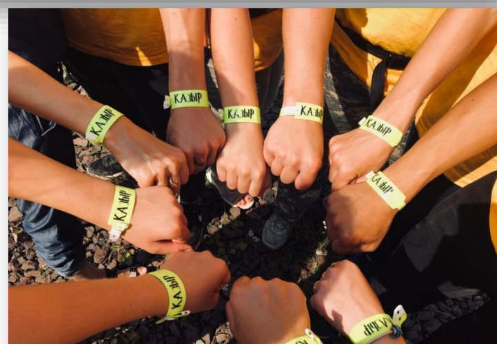
Туристический поход на Поднебесные Зубья