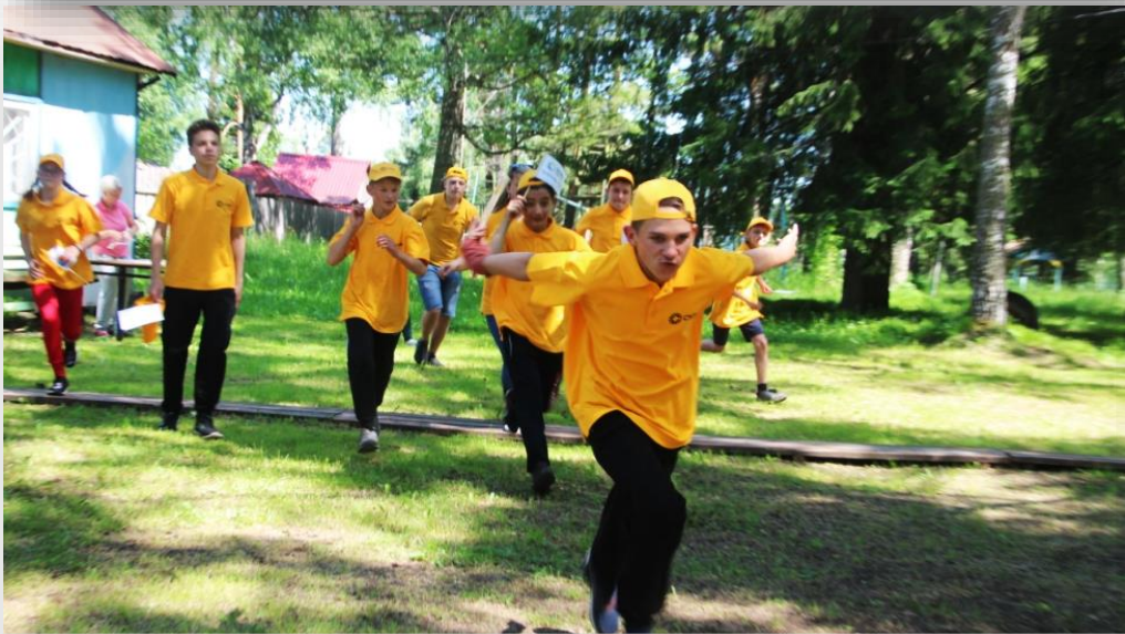
Профориентционный квест «Путешествие в мир профессий», г. Киселевск