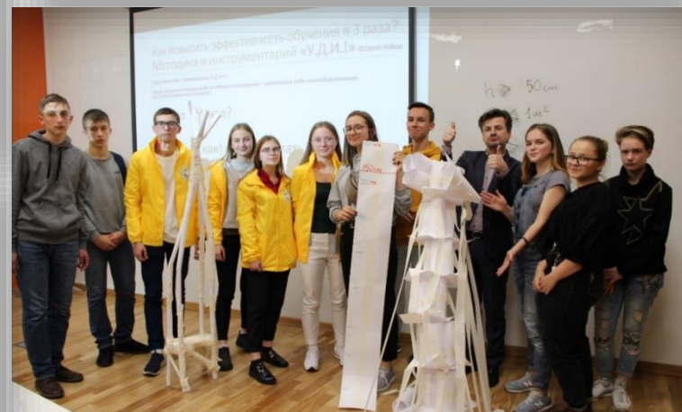
Семинар «Цифровые компетенции и навыки будущего» в РЭУ имени Г.В. Плеханова