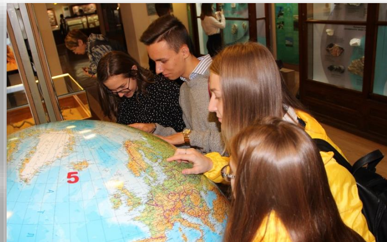
Путешествие участников ТОС в Москву