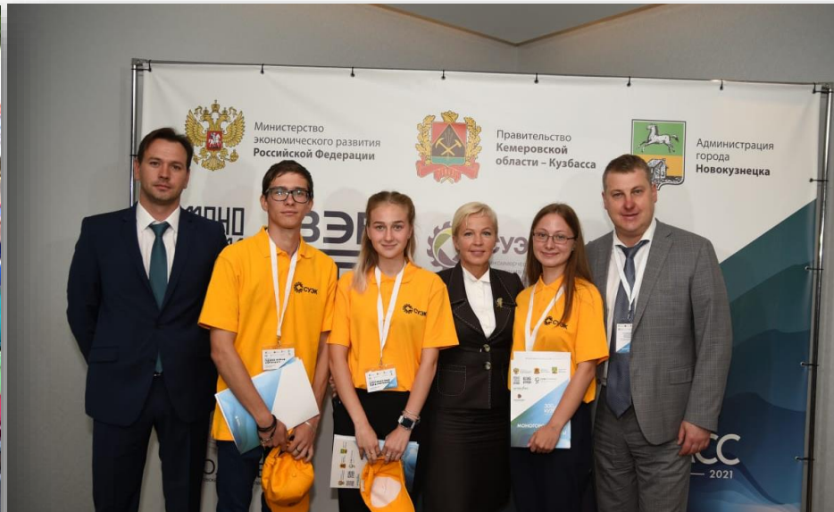
Стратегическая сессия «МОНОГРОДА 2024: НАЦПРОЕКТЫ», г. Новокузнецк