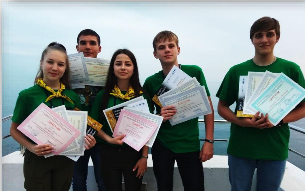
Лагерь «Молодой лидер», г. Сочи