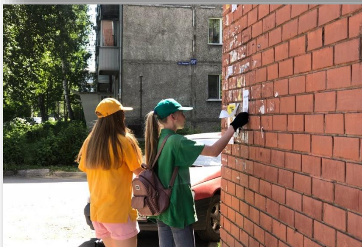
Благоустройство территорий - трудовые будни трудотрядовцев