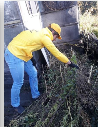
Акция «Ветеран живет рядом»