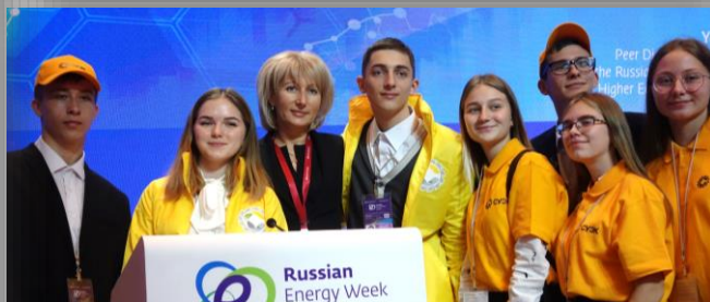
Участие трудотрядовцев в Российской энергетической неделе