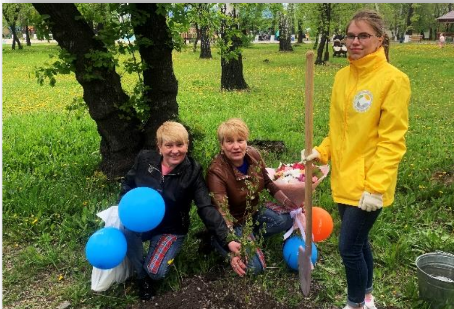
Посадка аллеи близняшек и двойняшек, г. Ленинск-Кузнецкий