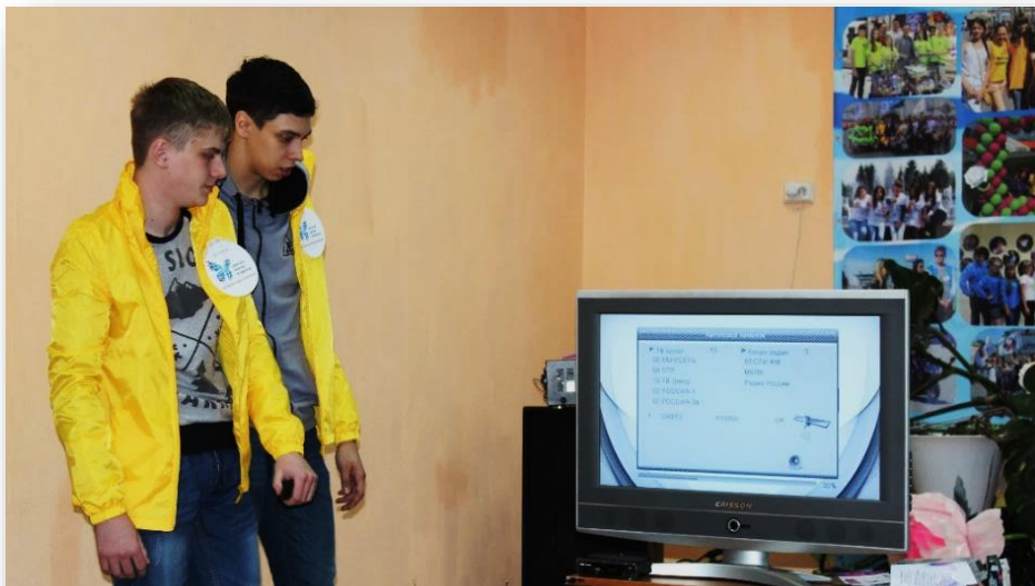
Акция по подготовке жителей к переходу региона на цифровое эфирное вещание