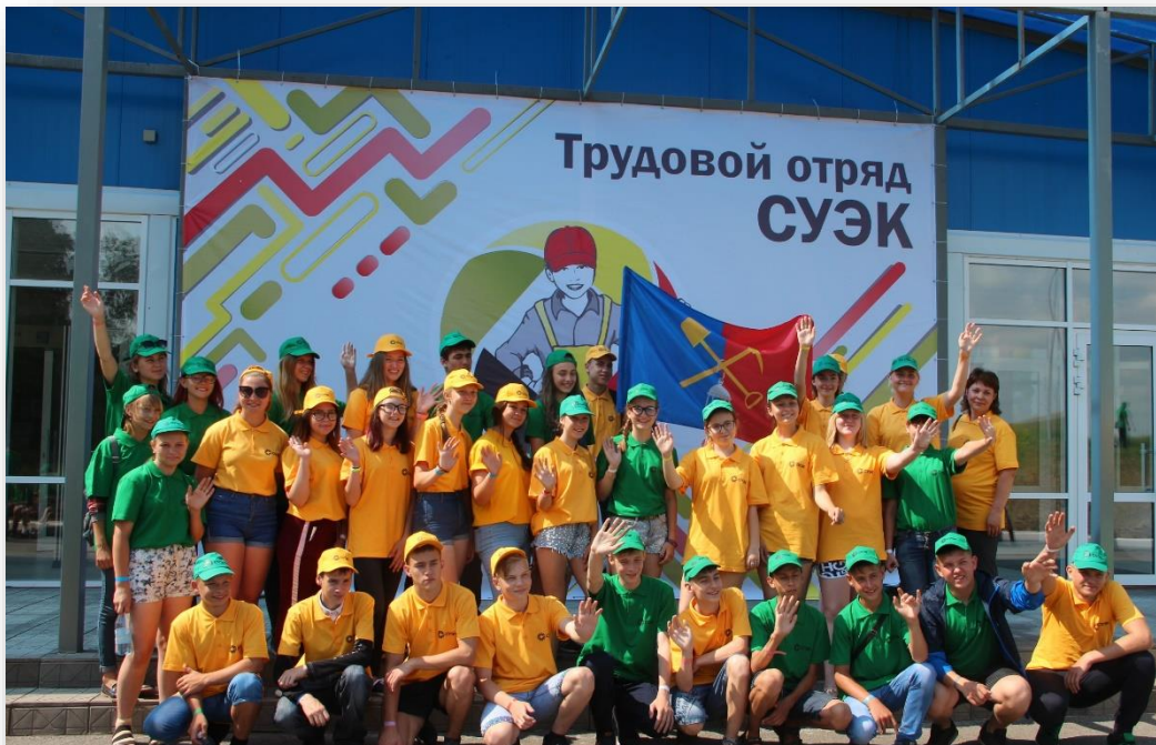
Слет Трудового отряда СУЭК