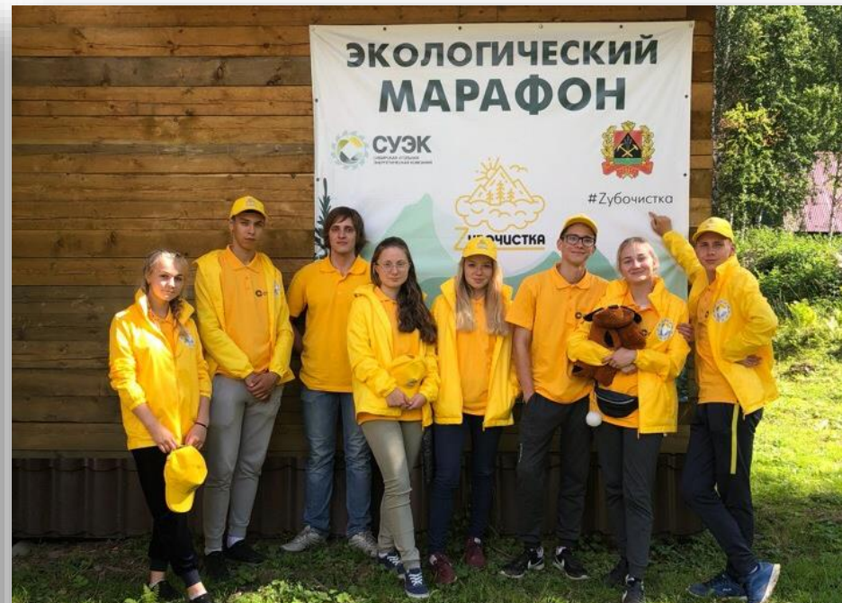
Участие в экологическом марафоне «Зубочистка»