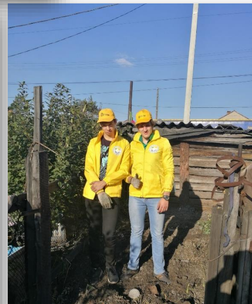
Акция «Ветеран живет рядом» - оказание адресной хозяйственно-бытовой помощи ветеранам ВОВ