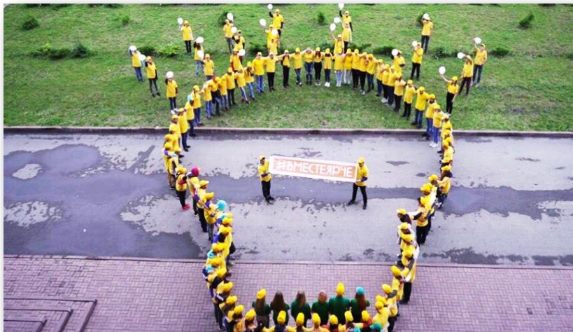
Флешмоб в поддержку Всероссийского фестиваля #ВместеЯрче, г. Ленинск-Кузнецкий

В 2019 году ТОС принял активное участие в мероприятиях, прошедших под эгидой фестиваля #ВместеЯрче Министерства энергетики РФ. Подведением итогов этой работы стала поездка ребят в Москву на Молодежный день РЭН, а также познавательно-развлекательная программа на несколько дней