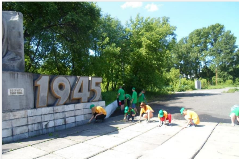
Акция «Дорога к мемориалу» - благоустройство памятников, мемориалов героям Великой отечественной войны, а также прилегающих к ним территорий