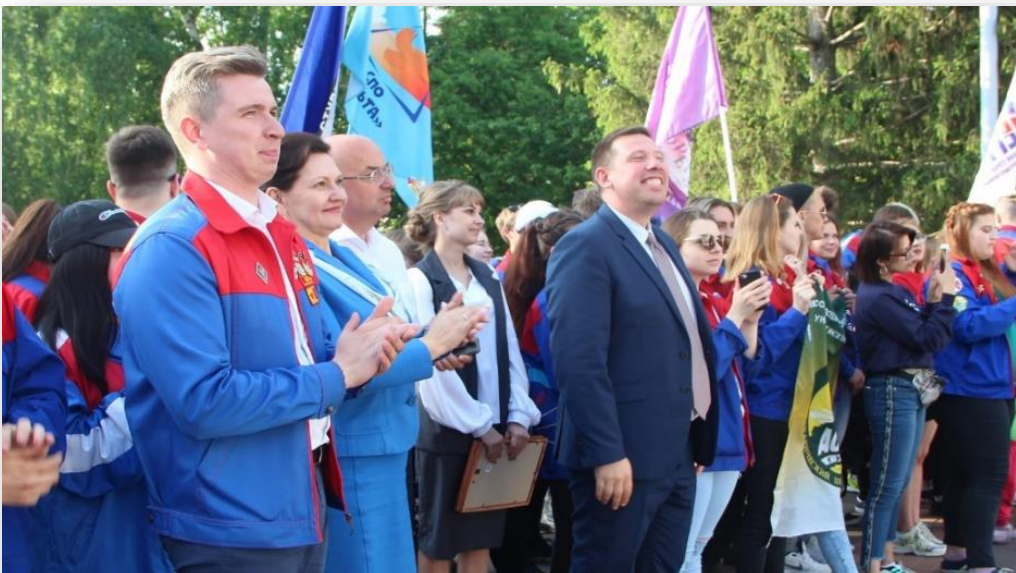
Слет ТОС. Открытие трудового сезона совместно с РСО, г. Кемерово