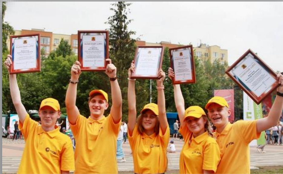
Вручение памятных адресов от Администрации КО за помощь в переходе региона на цифровое телевидение, г. Кемерово