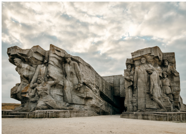
📍 Аджимушкайские каменоломни