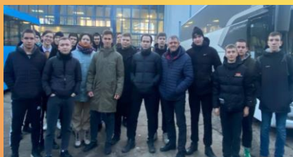
Волонтеры 100 человек