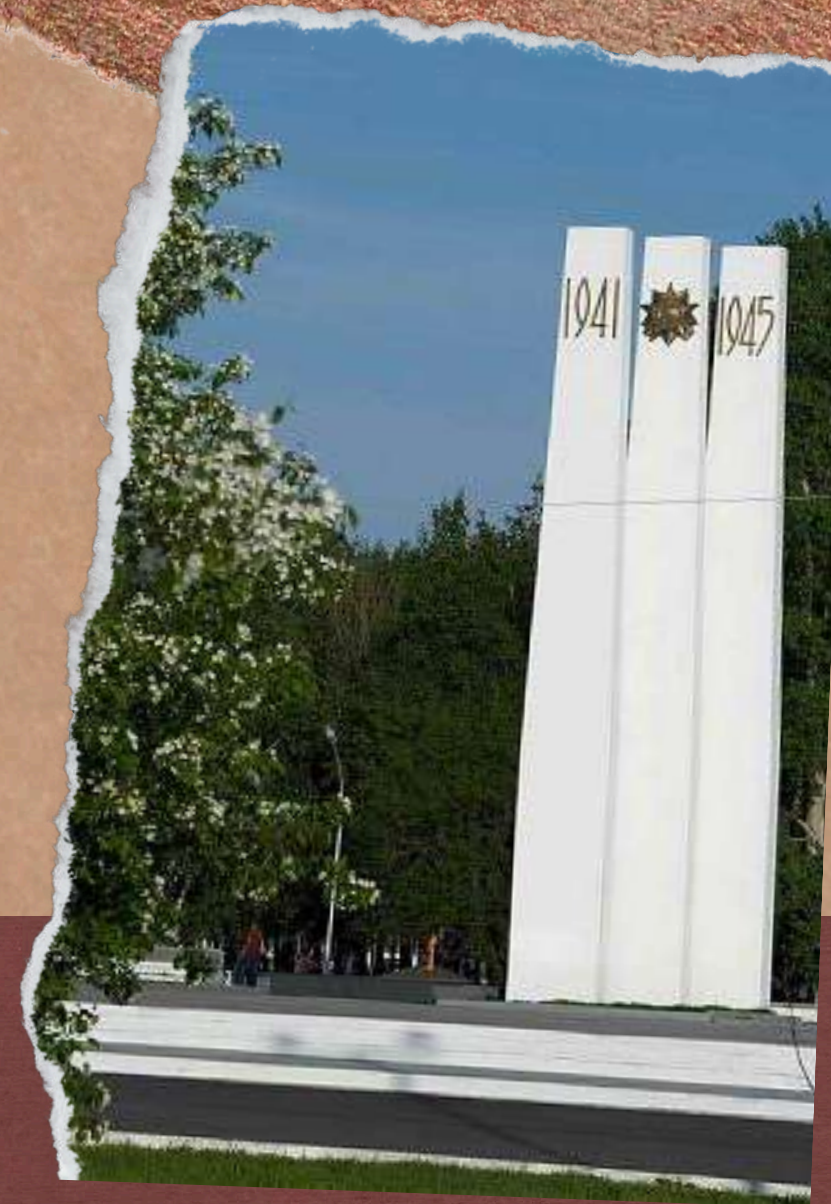
МЕМОРИАЛЬНЫЙ КОМПЛЕКС «ЗЕМЛЯКАМ - КОМСОМОЛЬЧАНАМ, ПАВШИМ В БОЯХ ЗА РОДИНУ В СУРОВЫЕ ГОДЫ ВЕЛИКОЙ ОТЕЧЕСТВЕННОЙ ВОЙНЫ»