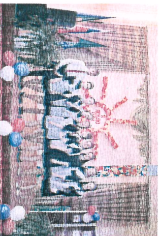
Лидер волонтерского объединения «Академия добра»

В следующем учебном году мы будем продолжать волонтерскую деятельность и привлекать в свои ряды нашего волонтерского объединения всех желающих. У нас много интересных дел впереди. Это подготовка и проведение традиционных благотворительных школьных, поселковых акций. После летних каникул у наших волонтеров, наверняка, появятся еще много интересных идей.