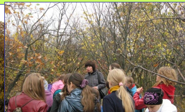
Экскурсии в лесничество.