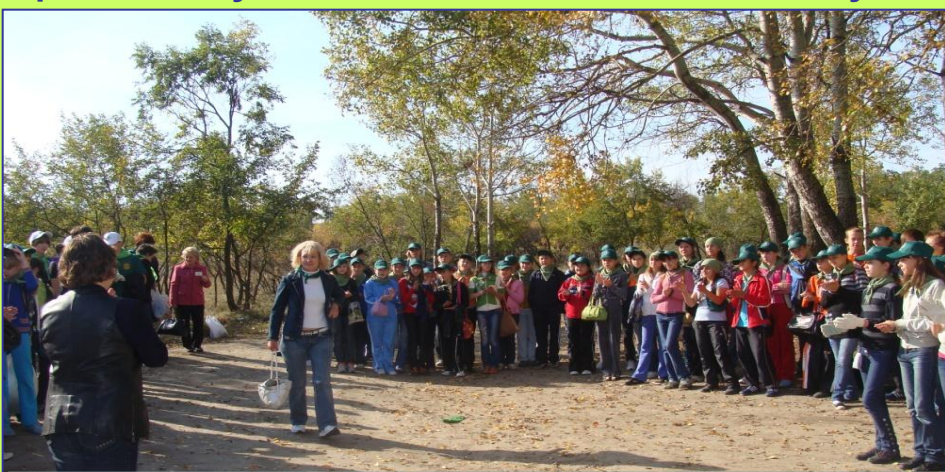
Акция «Чистый лес» (осень) – 2 этап – интеллектуальный марафон

Важным этапом нашего проекта стало проведение акции «Чистый лес». Она проводилась в 2 этапа: 1 этап - уборка территории леса. На этом этапе была проведена уборка территории 40 тыс.м2 в районе Кировского лесничества вокруг пруда Барыня и вывезено 20 м3 мусора. В акции принимали участие более ста пятидесяти обучающихся 6-10 классов.