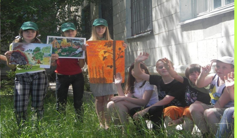
Акция «Лесным пожарам – STOP»

Ребята приняли участие в интеллектуальном марафоне «Лесная тропа», : «Птичьи трели», «Юный следопыт», «Дендрарий», «Дары леса», «Роца на мольберте», «Лесная поэзия», «Записки натуралиста», «У леса на опушке...».