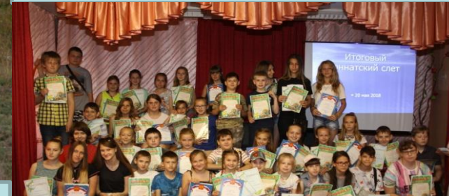
Конкурс «Эколидер» в рамках Всероссийской акции «Сделаем вместе»