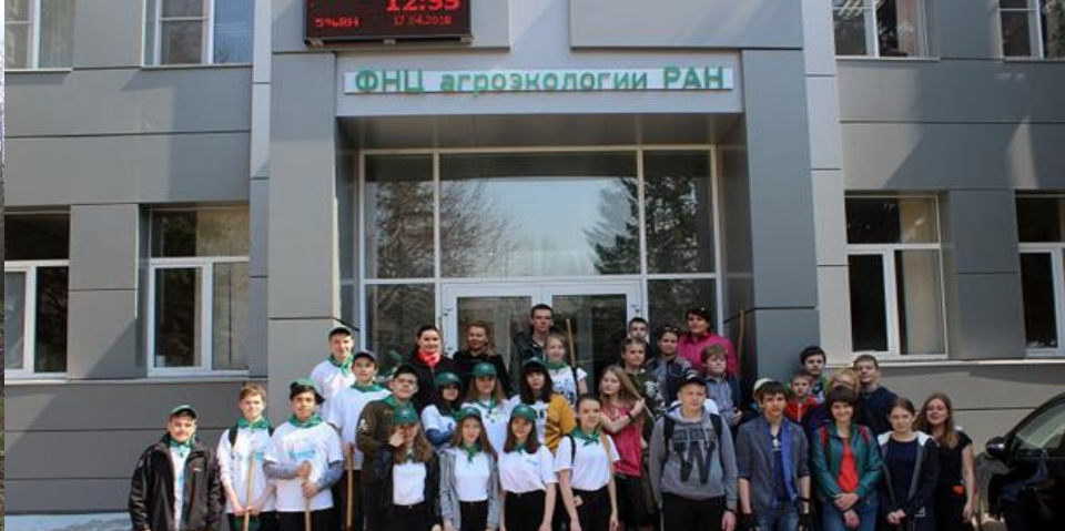
Акция «Чистый лес» в рамках Всероссийской акции «Чистый город – чистая страна» в кластерном дендрарии ВНИАЛМИ Волгограда (апрель)

23 апреля состоялся региональный этап Всероссийского экологического субботника "Зеленая весна - 2019" . Акция проходила на территории питомника ФНЦ агроэкологии РАН. Совместными усилиями был собран мусор, прошлогодняя листва, убран сушняк, обрезаны кустарники. В мероприятии приняли участие члены школьного лесничества "ЛЕСОГОР" и сотрудники ФНЦ агроэкологии РАН, Кузнецова