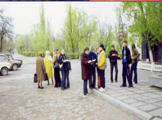
На территории Кировского лесничества был установлен щит с эмблемой «ЛЕСОГОРА». Теперь этот участок леса находится под нашей охраной