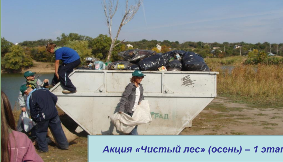
Акция «Чистый лес» (осень) – 1 этап – уборка территории леса