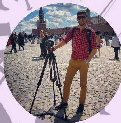
НАЗИМ ВИДЕООПЕРАТОР МОНТАЖ СЪЁМОЧНЫЙ ПРОЦЕСС

Наш девиз: работать хорошо, качественно, заряжая обучающихся позитивом, стремлением не только к знаниям и способностям, но и к красоте, к красивым поступкам, мыслям и красивому образу мыслей. А когда получается задуманное, это и есть искусство по нашему глубокому убеждению.