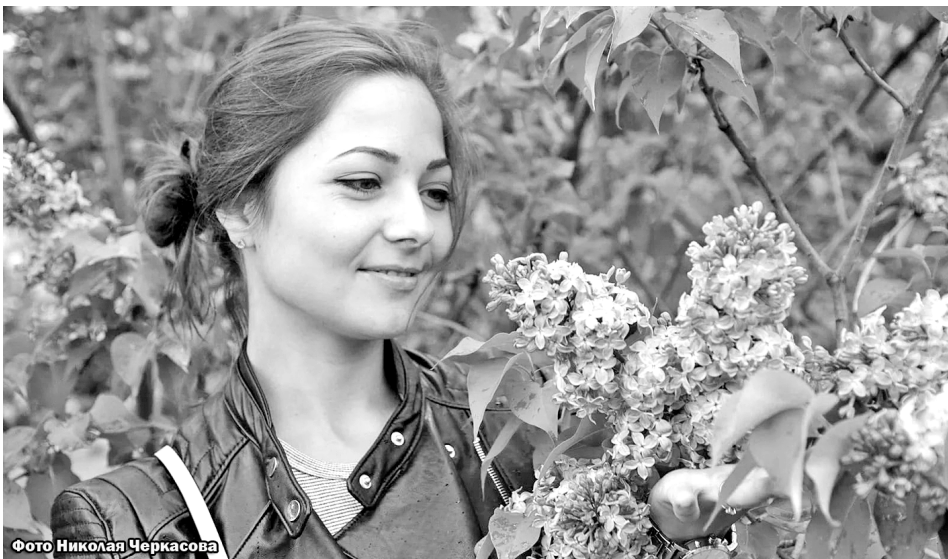
Фото Николая Черкасова

Главная концертная площадка будет украшена баннером, на котором главное место займёт портрет бывшего