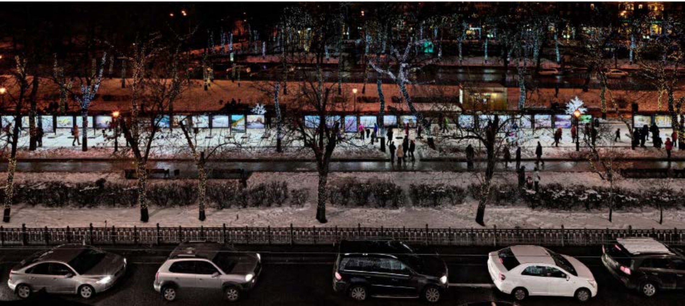
Галерея на Тверском бульваре (г. Москва)