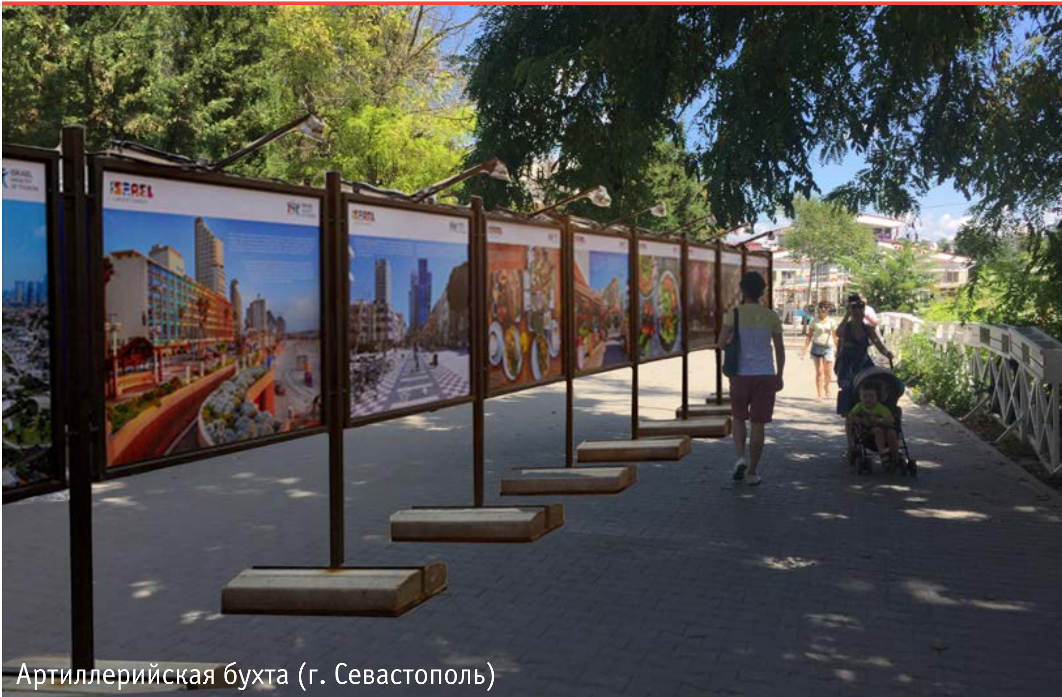
Артиллерийская бухта (г. Севастополь)