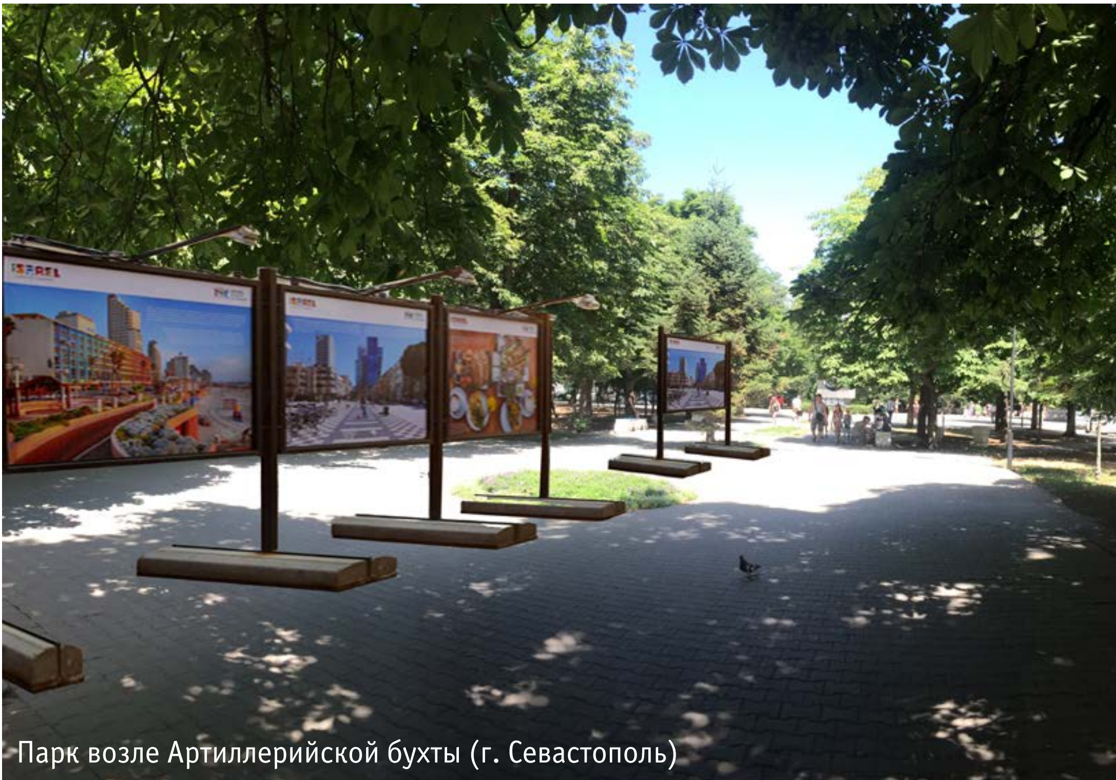
Парк возле Артиллерийской бухты (г. Севастополь)