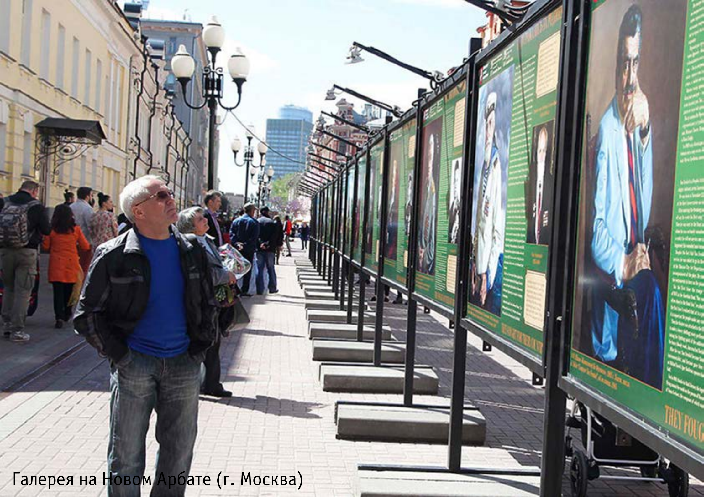
Галерея на Новом Арбате (г. Москва)