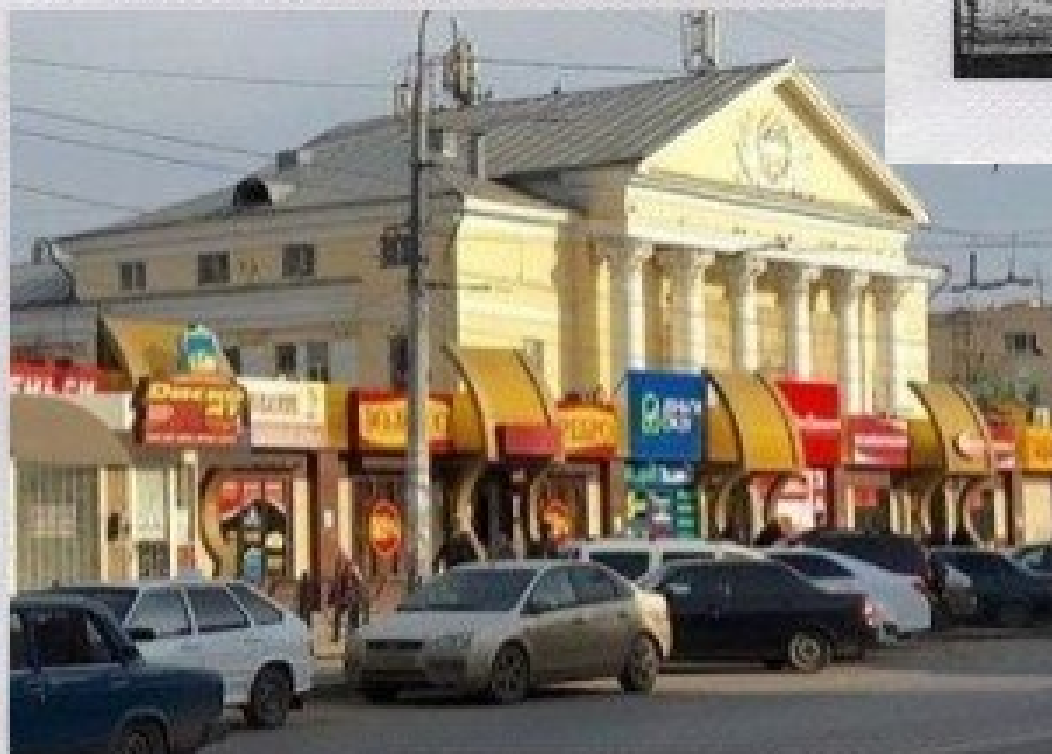
Клуб ТРЗ в 50-е годы и сейчас