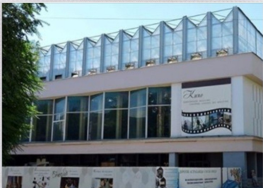
Кинотеатр "Октябрь" в 2015 и в 1956г