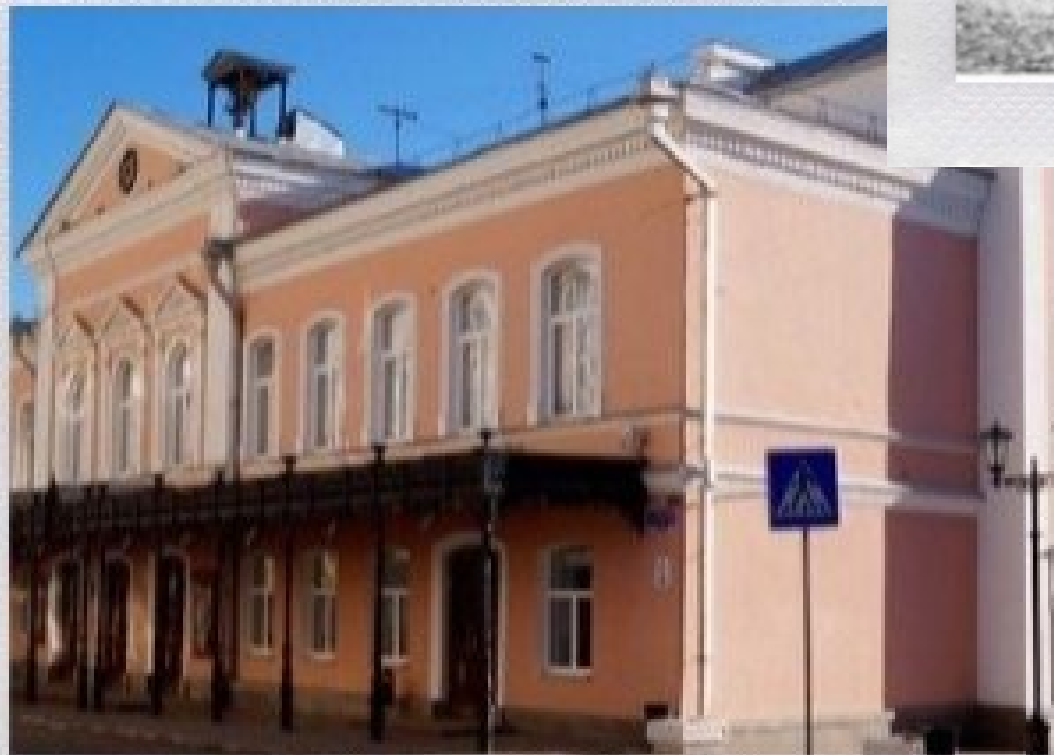
Сейчас и 100 лет назад