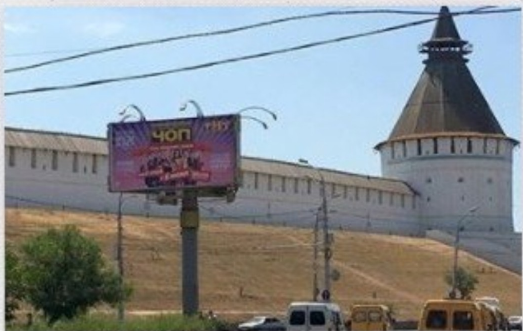
Октябрьская площадь сейчас и в июне 1979г