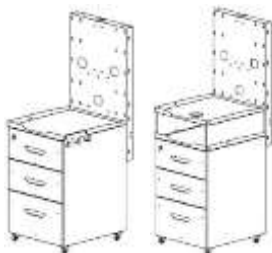
рис.2 Установка Панели на ТУМБУ 1.2 и ТУМБУ с НАДСТРОЙКОЙ 1.0 ТУМБА

«Окно» (2) - для светильника ЛЮКС АВЕРОН. «Окна» (3) - для проводки сетевых шнуров, соединительных проводов и шлангов.