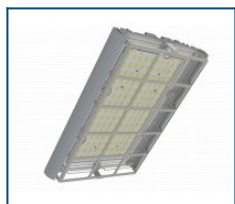
Решётка защитная Unit/Angar D60