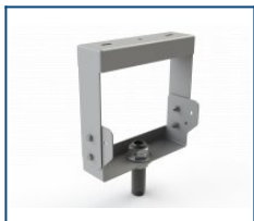
Кронштейн поворотный НСП (ВЗГ-200) (комплект)