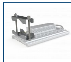
Регулируемый консольный кронштейн (до 82 мм)