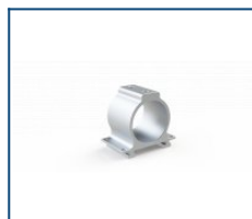
Консольный кронштейн Unit (комплект)