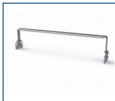
Кронштейн Лира Unit 180 (комплект)