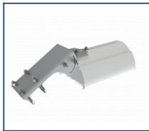
Кронштейн консоль поворотная Piton/Angar (комплект)