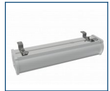
Скобы для накладного монтажа на стену Piton (комплект)