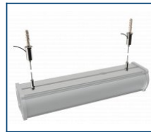
Кронштейн Piton тросовый подвес (комплект)