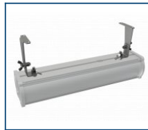
Кронштейн поворотный Piton (комплект)