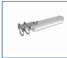
Кронштейн консольный Piton/Angar (комплект)