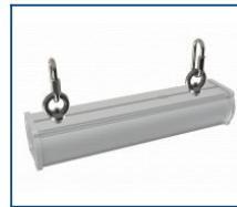
Кронштейн Diora Piton рым-болт (комплект)