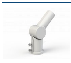
Кронштейн поворотный 90 град. Caiman / Unit