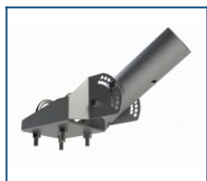
Кронштейн поворотная консоль (-20 до 75) (комплект)