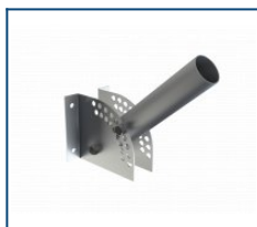
Настенный кронштейн для консольного крепления с регулировкой угла наклона