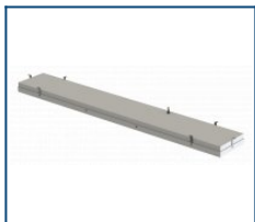
Комплект подвесов для NRO IP65