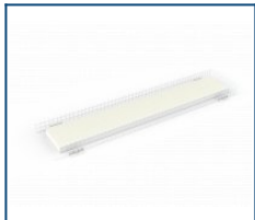
Защитная решетка NRO (1270*250*70)