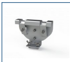
Кронштейн на трос Unit (комплект)