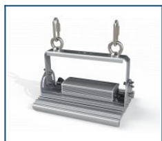
Крепление Рым-болт М6 Unit (комплект)