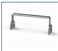
Кронштейн Лира Unit 90 (комплект)