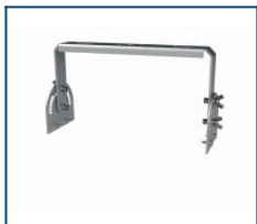
Кронштейн Лира Unit 60 (комплект)