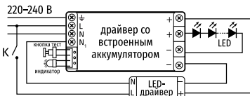
Схема подключения БАП в светильнике ДВО-15-А