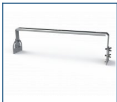
Кронштейн Лира Unit 120 (комплект)