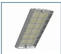
Решётка защитная Unit/Angar D90