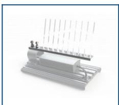
Отпугиватель для птиц Unit D90 (комплект)