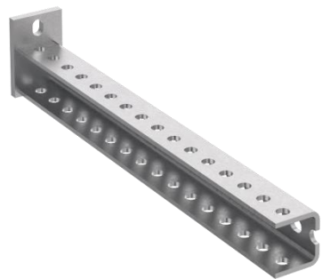
Консоль П-образная легкая