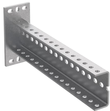
Консоль П-образная средняя