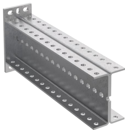
Консоль П-образная усиленная