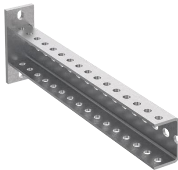
Консоль П-образная облегченная