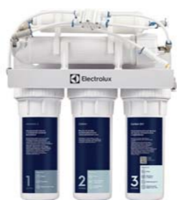
RevOs OsmoProf 500