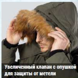
Увеличенный клапан с опушкой для защиты от метели