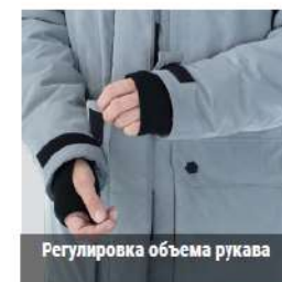
Регулировка объема рукава