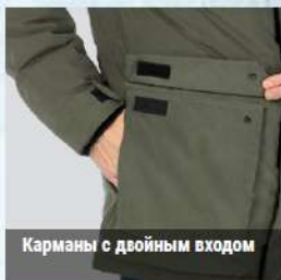
Карманы с двойным входом