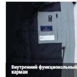
Внутренний функциональный карман