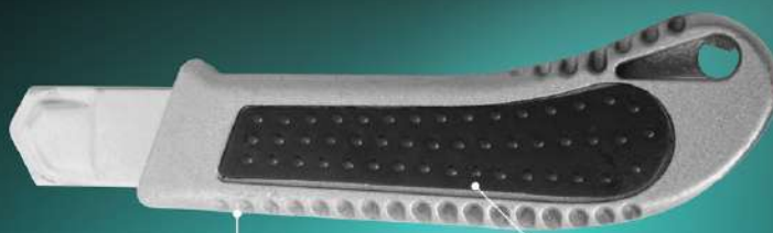
Усиленный алюминиевый корпус