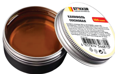
APL10-100 арт. 50073