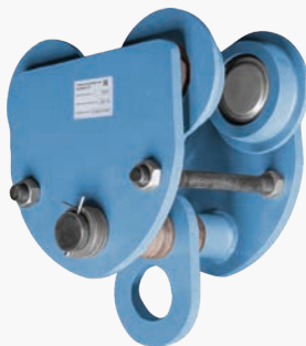
Тележки для ручных талей GEARSEN GCT (холостая)