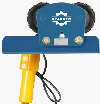
Тележки для электрической стационарной мини тали GEARSEN PA