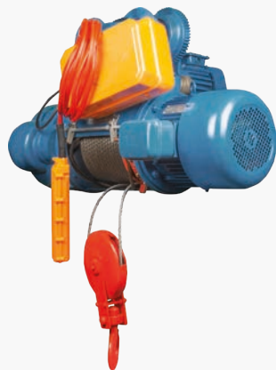
Электрические канатные тали с одной тележкой GEARSEN CD