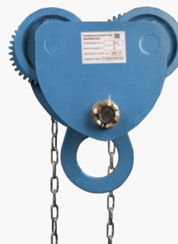
Тележки для ручных талей GEARSEN GCL (приводная)