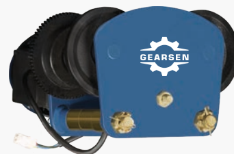
Тележки для электрической комбинированной мини тали GEARSEN PA