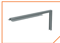
a5060 Кронштейн BS-K-4 Gray