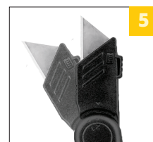
два угла фиксации