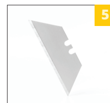
сменные лезвия в комплекте