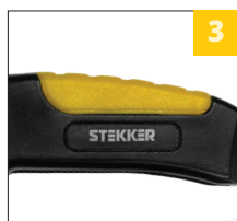
отсек для хранения лезвий