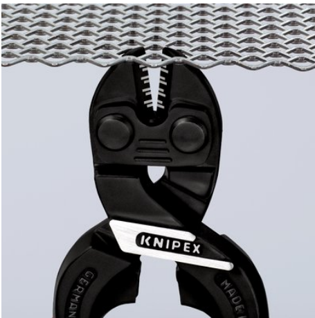
Тонкая головка для оптимального доступа к детали