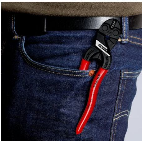
Компактный, лёгкий и всегда под рукой