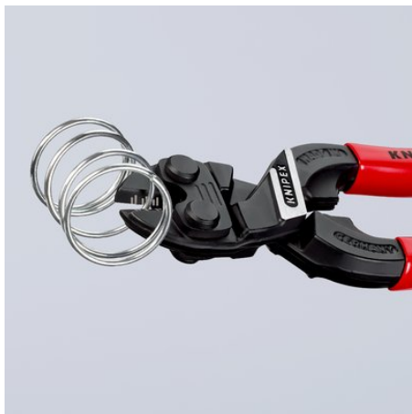
Отличная режущая способность до самых кончиков