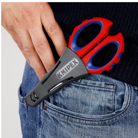
!Sicher verstaut und immer griffbereit!