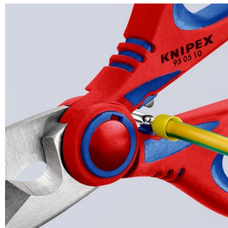
Быстрый и простой обжим