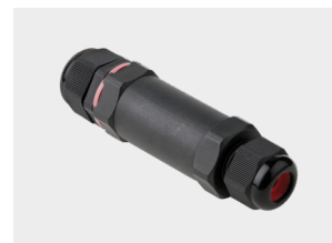
Кабельный соединитель Арт. Зpin-IP68-4-12