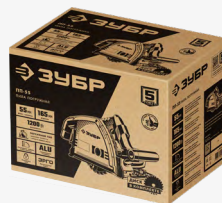
Упаковка: коробка картонная