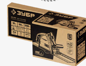
Упаковка: коробка картонная