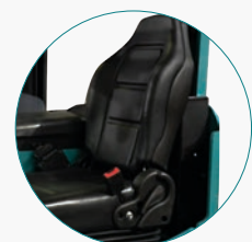
эргономичное сиденье оператора с возможностью регулировки