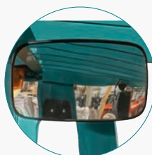
панорамное зеркало для оператора