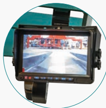
видеокамера и дисплей в базовой комплектации