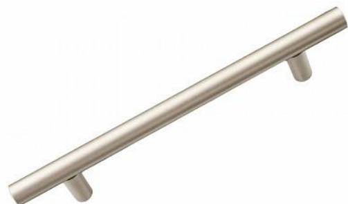
Ручки-рейлинги САТИН 8 SKU