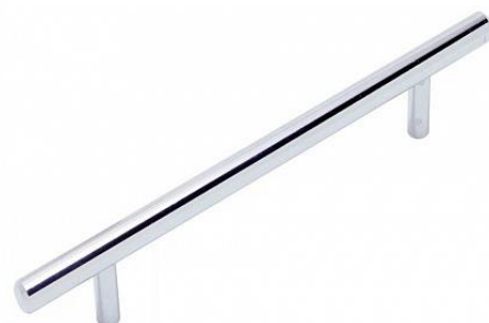
Ручки-рейлинги ХРОМ 8 SKU