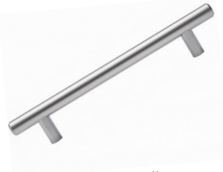
Ручки-рейлинги МАТОВЫЙ ХРОМ 8 SKU