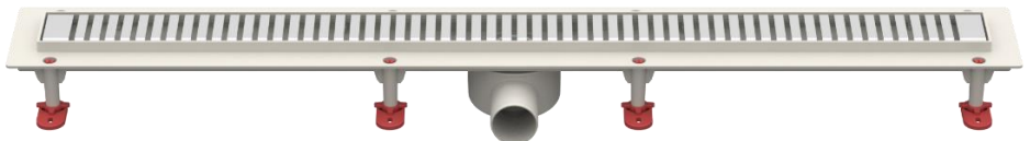
Рис.4 – Решетка тип D «Полосы»

Партия трапов, поставляемая в один адрес, комплектуется паспортом и объединенным техническим описанием в соответствии с ГОСТ 2.601-2006.