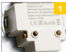
латунная контактная группа