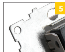
прочный гальванизированный суппорт