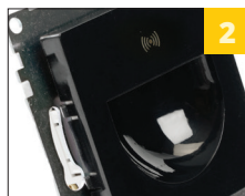
поверхность из прочного стекла