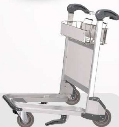
тележки для багажа