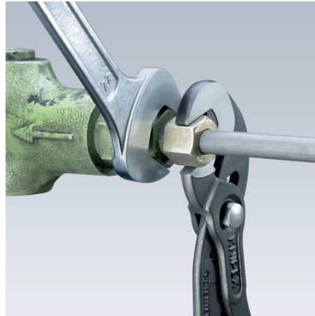
Самофиксирующиеся: не соскальзывают с детали, меньше усилия при работе