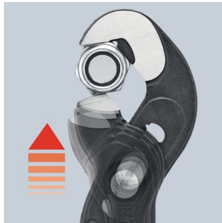
Точная настройка нажатием кнопки: быстро и удобно