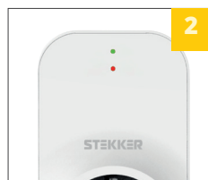
индикатор серии VP нерегулируемый