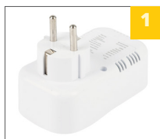
огнестойкий PC пластик