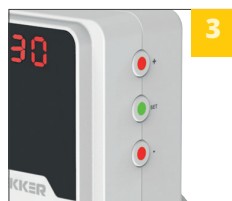
серия VPR-возможность регулировки напряжения и времени срабатывания