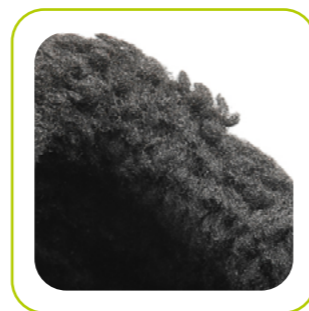
ПОДКЛАДКА: ИСК. МЕХ