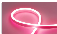
арт. 32712 красный