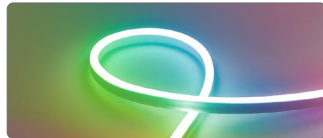
арт. 52112/52111/51975 RGB

8 W/m 72 LED/m 5/10/50m (в бобине) LS720