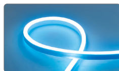
арт. 32713 синий