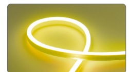
арт. 32715 жёлтый