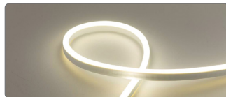
арт. 32711 3000K