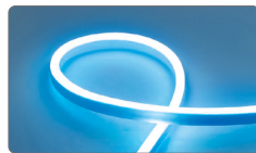
арт. 29563 синий