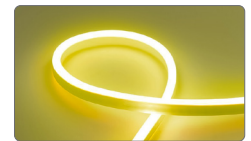
арт. 29565 жёлтый