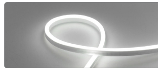
арт. 48204 4000K