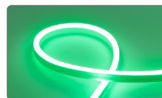
арт. 32714 зеленый