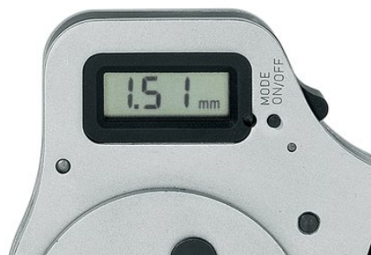
Мультифункциональный дисплей, настройка в мм, дюймах или сравнимые позиции для выбора согласно MIL