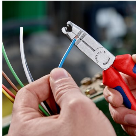
с отверстиями для удаления изоляции с проводов 1,5 и 2,5 мм 2